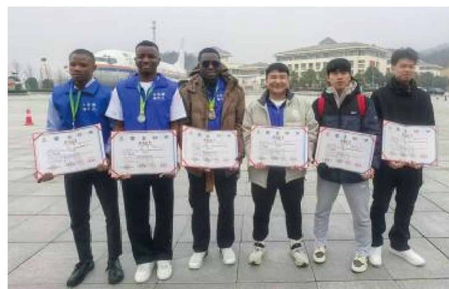
參加一帶一路的“新能汽車創新賽” 榮獲國賽三等獎