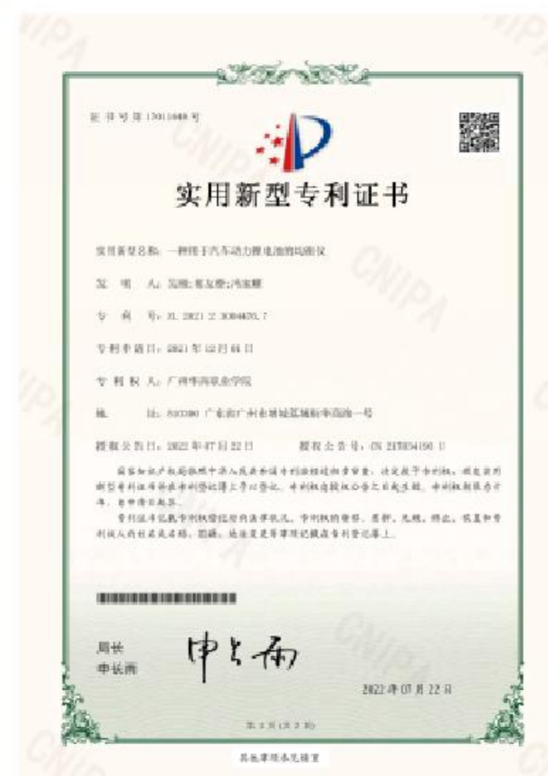
學生製作 《動力電池均衡儀》 實用新型專利授權