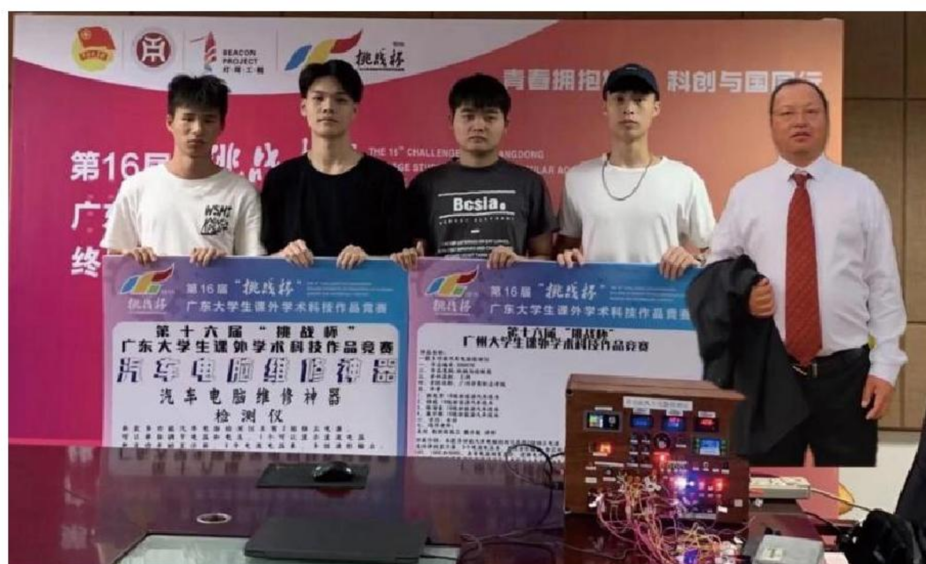
省級大學生課外學術科技作品《一款多功能汽車電腦檢測儀》 “十六屆挑戰杯”省級一等獎