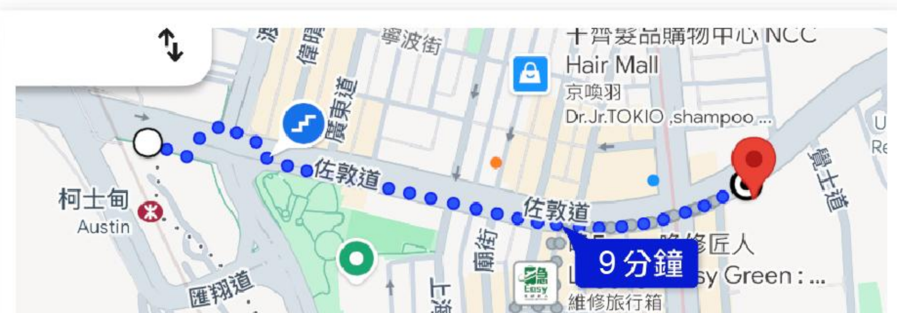
距離西九龍高鐵站僅9分鐘步行路程